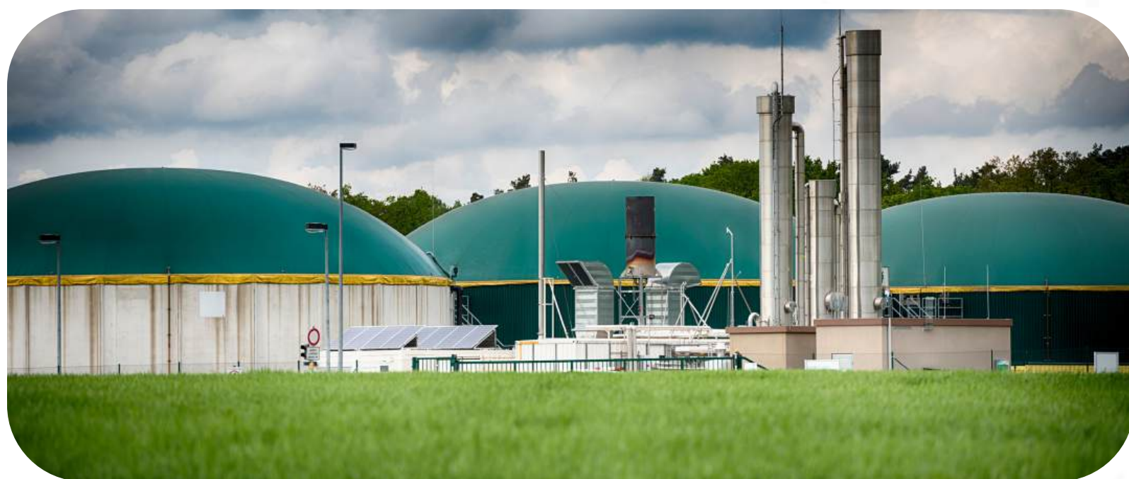
*Ciepłownie i elektrociepłownie

W przypadku uzyskania takiego finansowania inwestycja może zostać korzystnie sparametryzowana doprowadzając do zadowalających poziomów zwrotów z projektu.